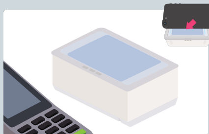
QRコード・バーコード型の スマホ決済