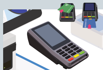
電子マネー・クレジットカード 非接触型スマホ決済