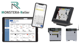
オーダーエントリーシステム