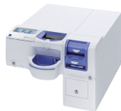
硬貨つり銭機 紙幣つり銭機 RT-380 RAD-380