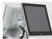
背面ディスプレイ