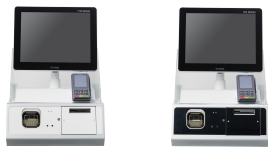
セルレジシステム CashHive